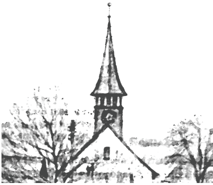
Reformierte Kirche Weiach